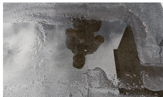
Nyt tagpap her?