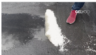
4 minutter senere

GelyGo er din hjælpende hånd. Et nyt produkt der hjælper dig med at holde vandet væk fra arbejdsområdet og sparer dig for helt op til 50% af din tid .